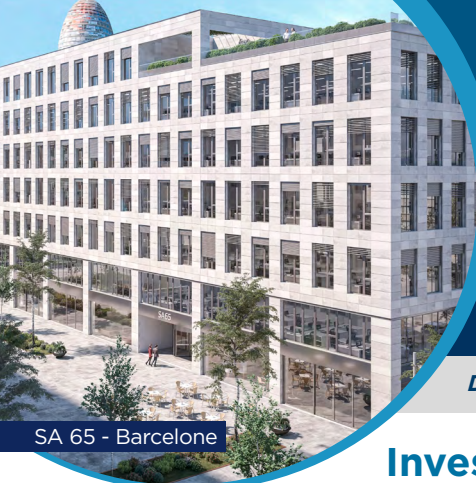
SA 65 - Barcelone