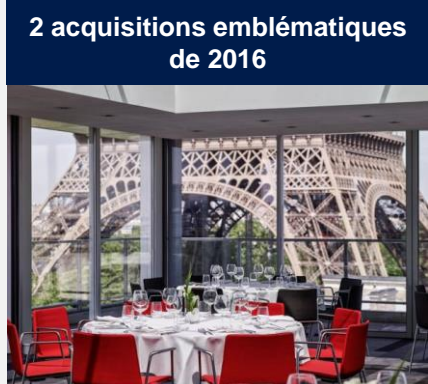
2 acquisitions emblématiques de 2016

Selon les opportunités, le Fonds devrait continuer à affirmer son ADN international. Il pourrait ainsi poursuivre ses investissements en Europe du Sud. Pour ce qui est du Royaume-Uni, même si Opcimmo a réduit la voilure en 2016, le Fonds garde un œil ouvert sur la 5ème puissance économique mondiale.