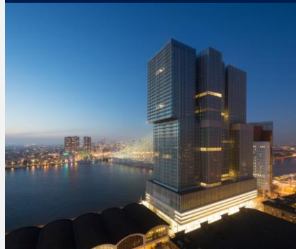
PAYS-BAS – ROTTERDAM Immeuble de Rotterdam Wilhelminakade 139, 3072 MC